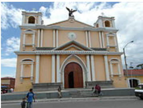
Iglesia de San Miguel Petapa.

Tras la Independencia de Centroamérica y durante el gobierno de Mariano Rivera Paz, por decreto del 6 de noviembre de 1839, Amatlán formó un distrito independiente junto con Palín y Villa Nueva para su gobierno político. 27 El decreto del 6 de noviembre de 1839 textualmente dice: